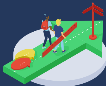
2. (Door)ontwikkelen van begeleidingsstructuur: maatwerk