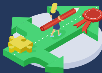
1. Persoonlijk maatwerk en hybride leren

In Programmalijn 4 staat het professionaliseren van docenten en praktijkopleiders centraal, zodat zij hun rol in de hybride leeromgeving goed kunnen vervullen. Dankzij de oprichting van een practoraat, wordt bij de professionalisering de meest recent vergaarde kennis gebruikt. Deze kennis wordt vernieuwd, gedeeld en geborgd binnen een Learning Community, die een brug slaat tussen onderwijs, bedrijfsleven en overheid.