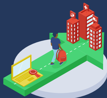
3. Aansluiting van onderwijs op bedrijven in kansrijke sectoren