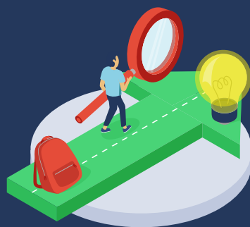
4. Learning Community en innovatie